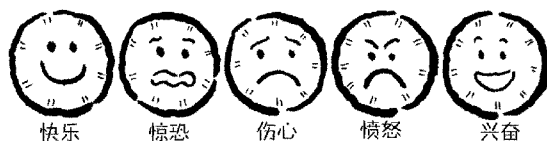
快乐 惊恐 伤心 愤怒 兴奋